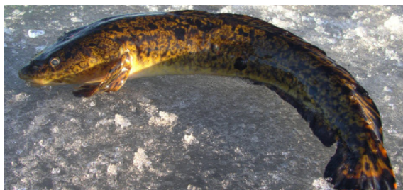
Att få lake mitt på dagen är ovanligt, men det inträffar ibland.