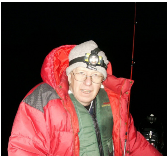
Nattfiske i öppet vatten. Utmattad med Nils Master-spöet och många lager kläder.