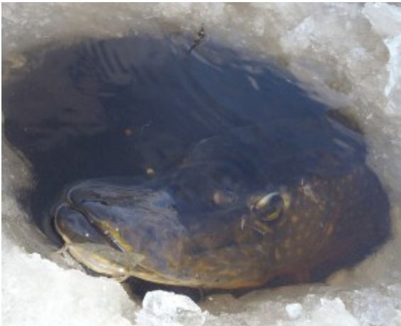
Gädda på 95 cm på ismete vid den rätta tiden.

Natur & Fiske-serien med e-böcker på många språk och ljudböcker på svenska och engelska och har arbetats fram i projektet "Natur- och fiskeinformationsmaterial" som har fått stöd av Leader Linné.